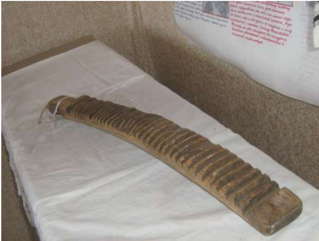
Рубель – приспособление для глажки белья