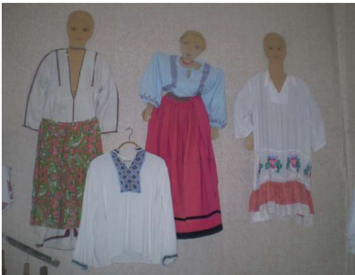
(слева-направо): 1.Мордовское платье; 2. Мужская русская рубаха 3.Русская женская одежда; 4. Марийское свадебное платье