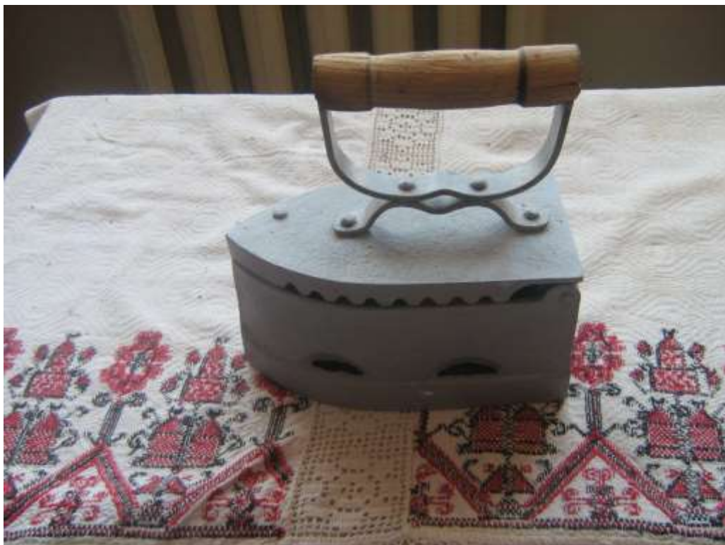
Утюг на углях