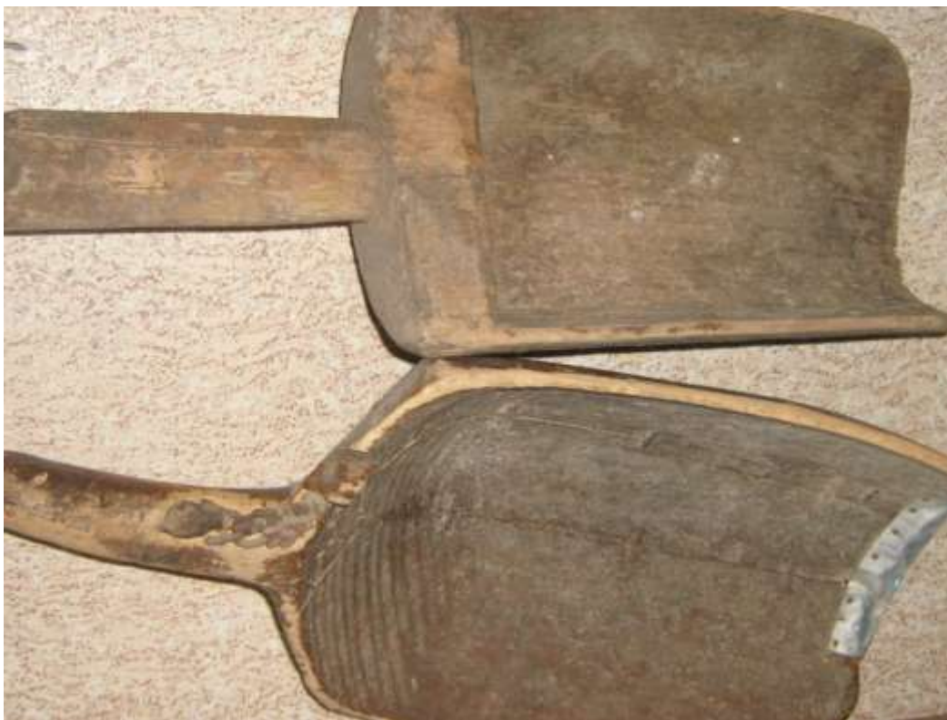
Совок из дерева для зерна