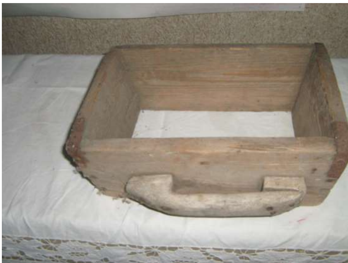
Станок для изготовления кизяков (грудок – кирпичей из глины и навоза, предназначенных для отопления жилья)