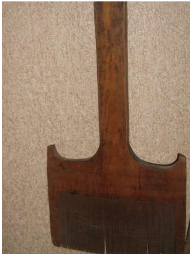
Гребень для чески льна