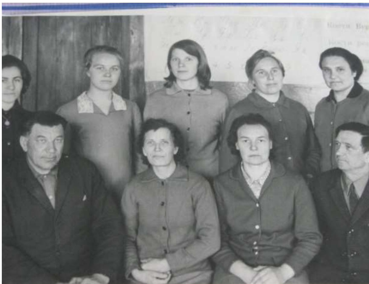
Коллектив учителей Парфеновской школы 1970 год