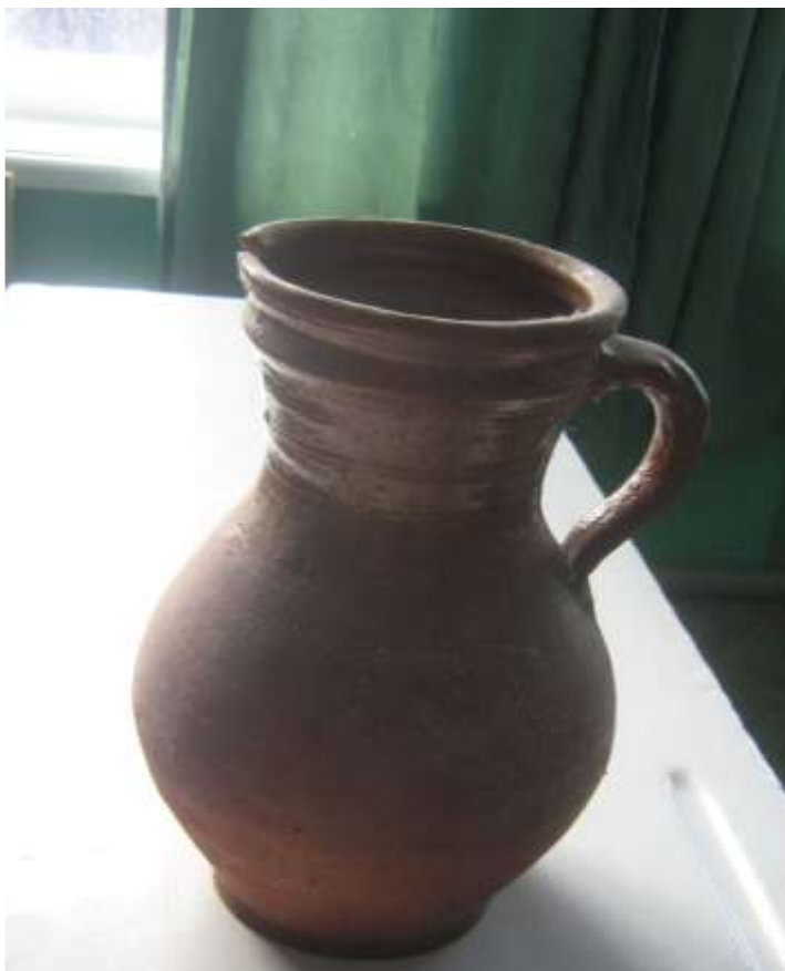
Кувшин глиняный «крынка» для молока