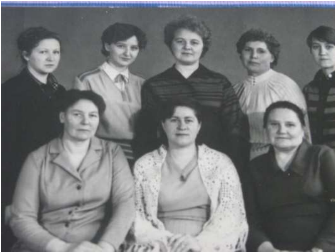
Коллектив учителей Парфеновской школы 1985 год