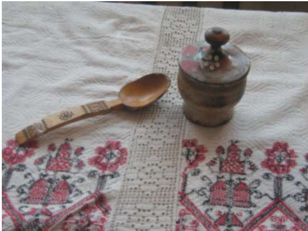
Солонка и ложка деревянные