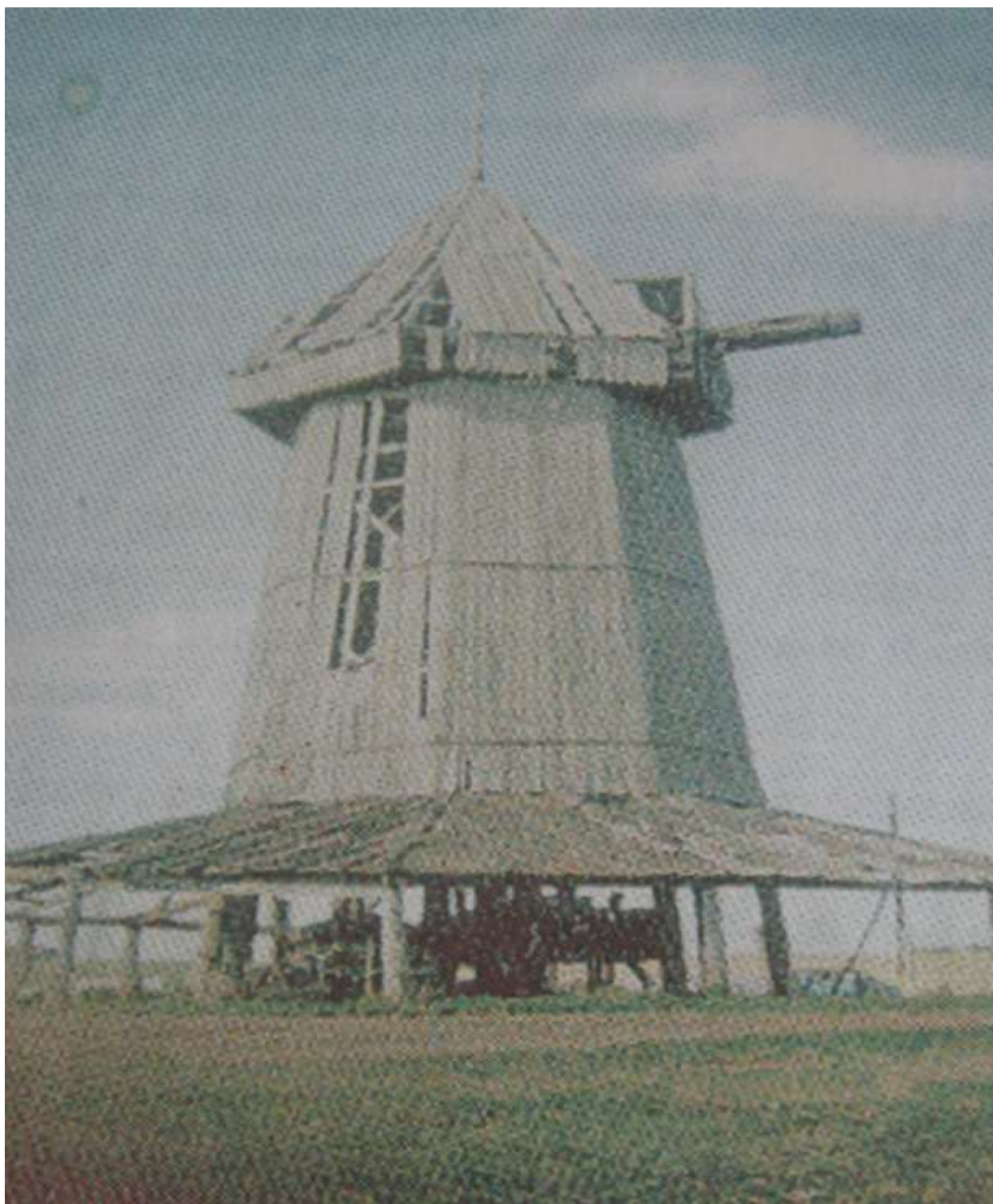
Ветряная мельница, свидетель прошлого века, ровесница села Парфеновка