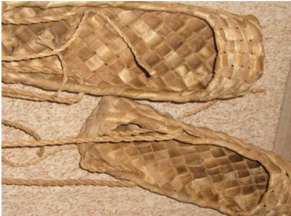
Лапти – крестьянская обувь