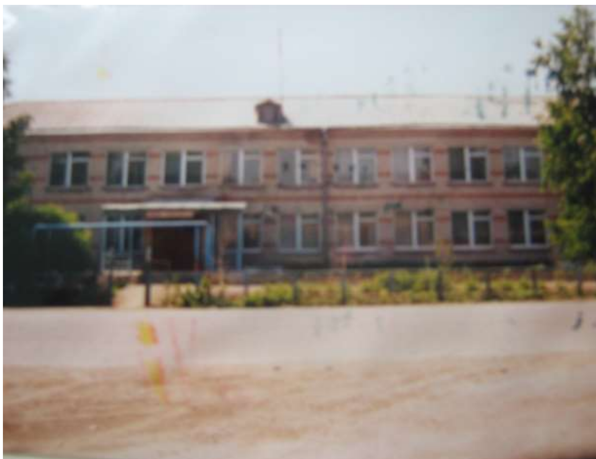
Здание Парфеновской школы в настоящее время