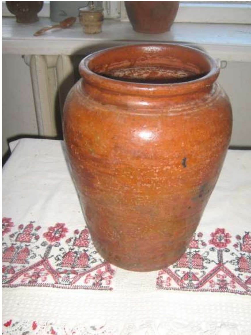
Корчага глиняная для хранения масла и крупы