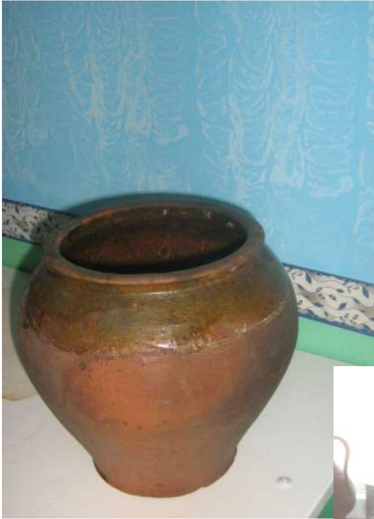
Горшок для хранения масла