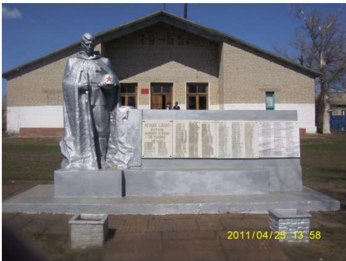
Сельский клуб и памятник погибшим в Великой Отечественной войне