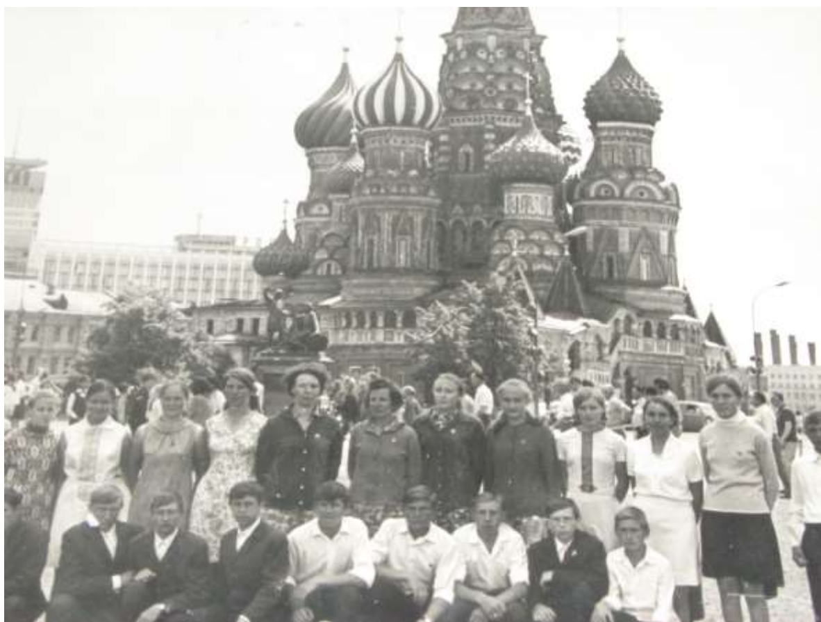
Москва 1973 год