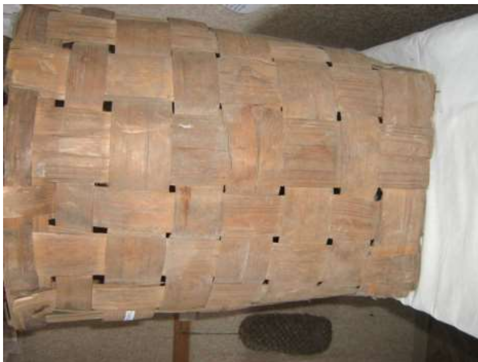
Короб из бересты для хранения шерсти, льна