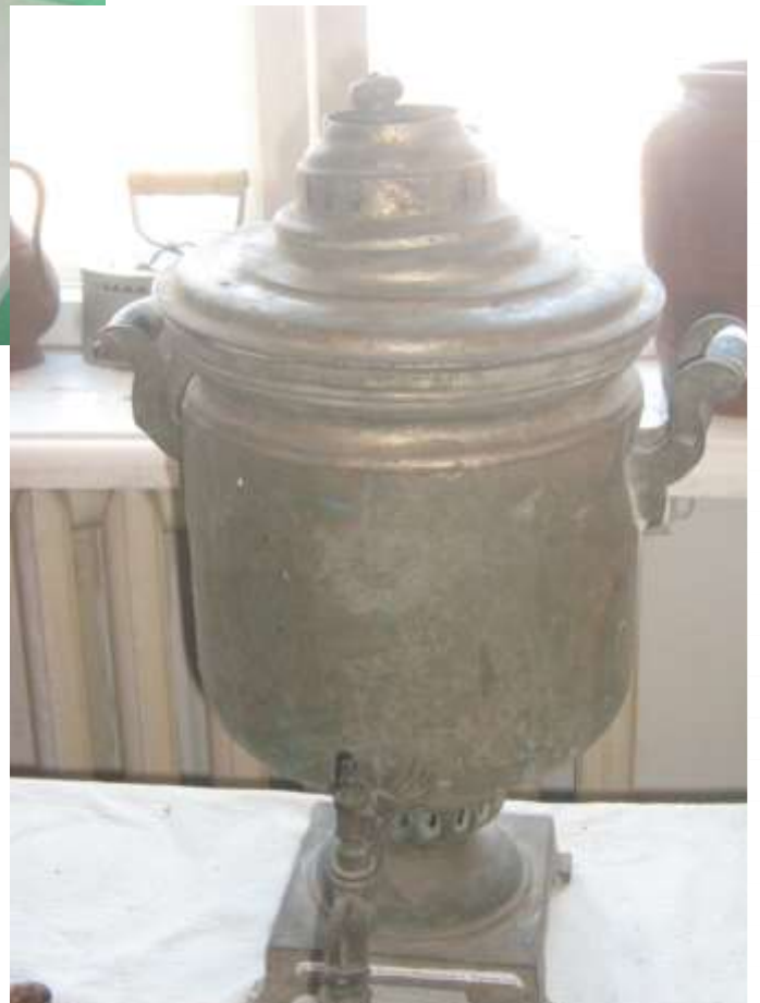
Медный самовар «начало XX века»