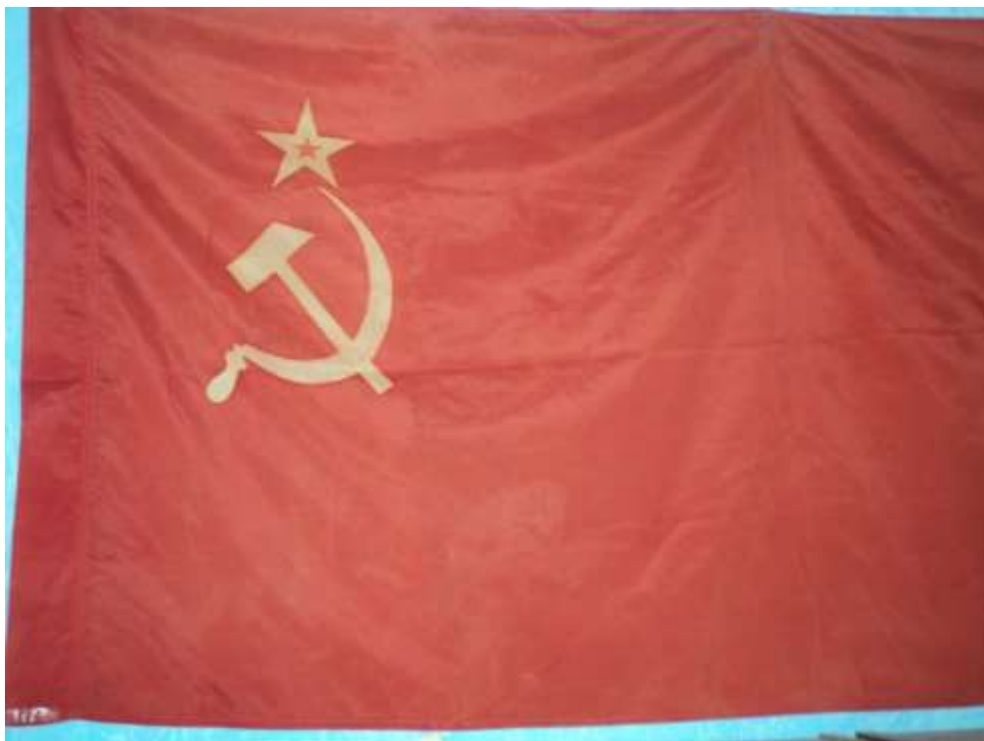
Государственный флаг СССР